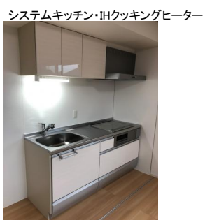
システムキッチン・IHクッキングヒーター