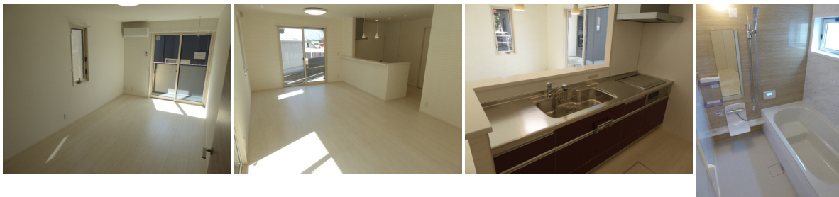
B 洋室8.75帖 B LDK18帖 B キッチン B 追焚機能付一坪風呂