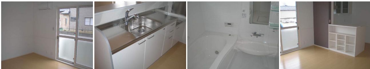
101LDK 101物入れ 101浴室 101対面カウンター