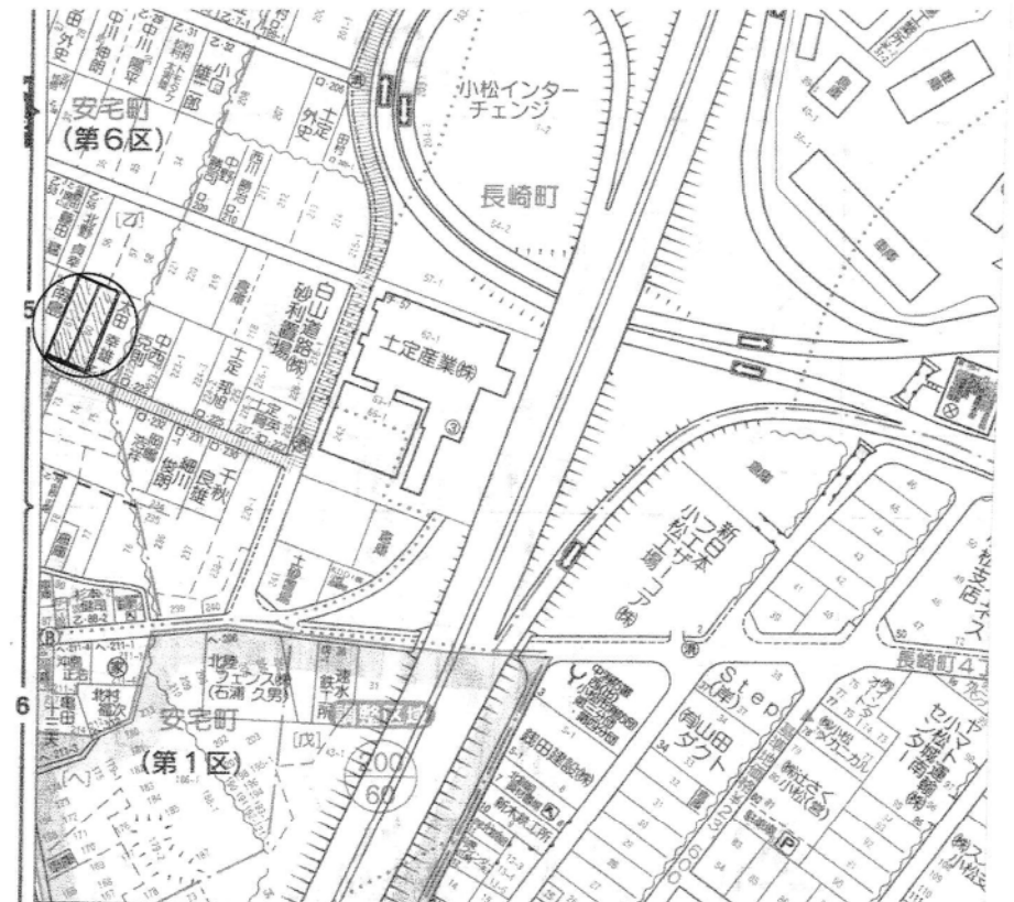
地番 60-2, 61-1, 61-2 地積測量図