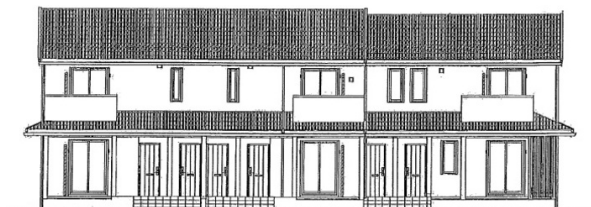
※完成予想図につき実際とは異なる場合があります