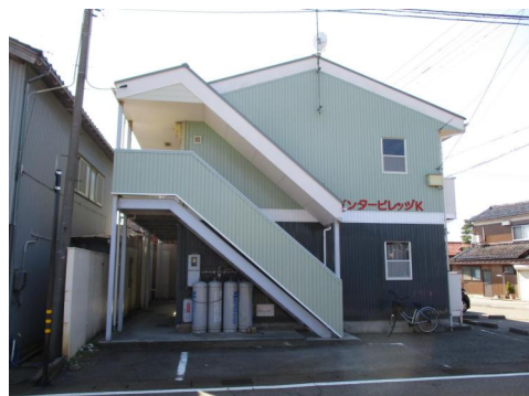
インタービレッジK 102号室

小松インター、小松空港、小松基地周辺に通勤が便利！TVドアホン、ウォシュレットトイレ、エアコン。単身の方おすすめです。お気軽にお問い合わせください。間取り反転タイプ。