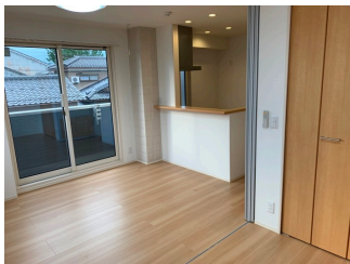
IH+電熱付き対面システムキッチン