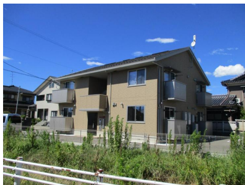
アビタシオン北浅井105号室