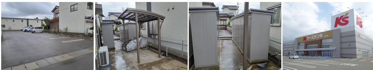
駐車場 サイクルポート 物置 周辺施設：ケーズデンキ