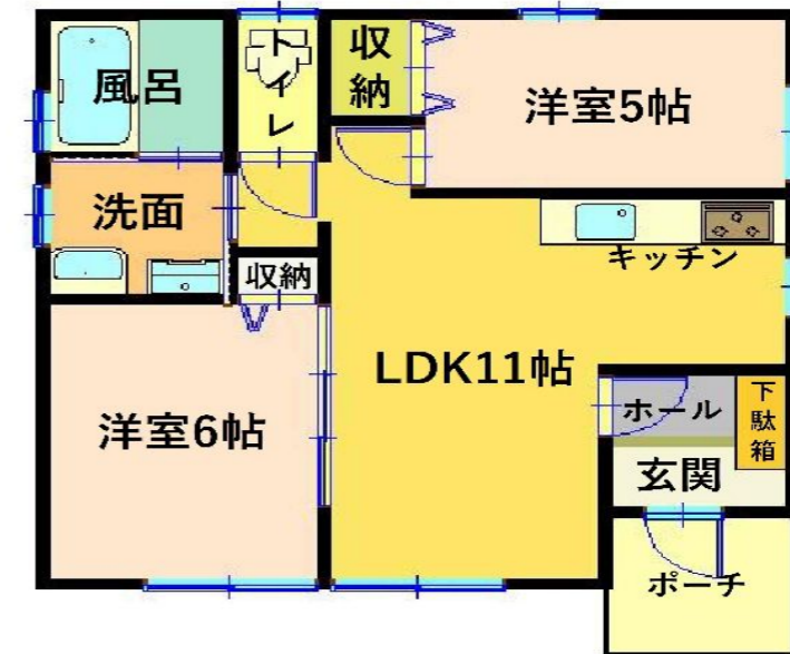
WEST10 (ウエスト10) 間取図